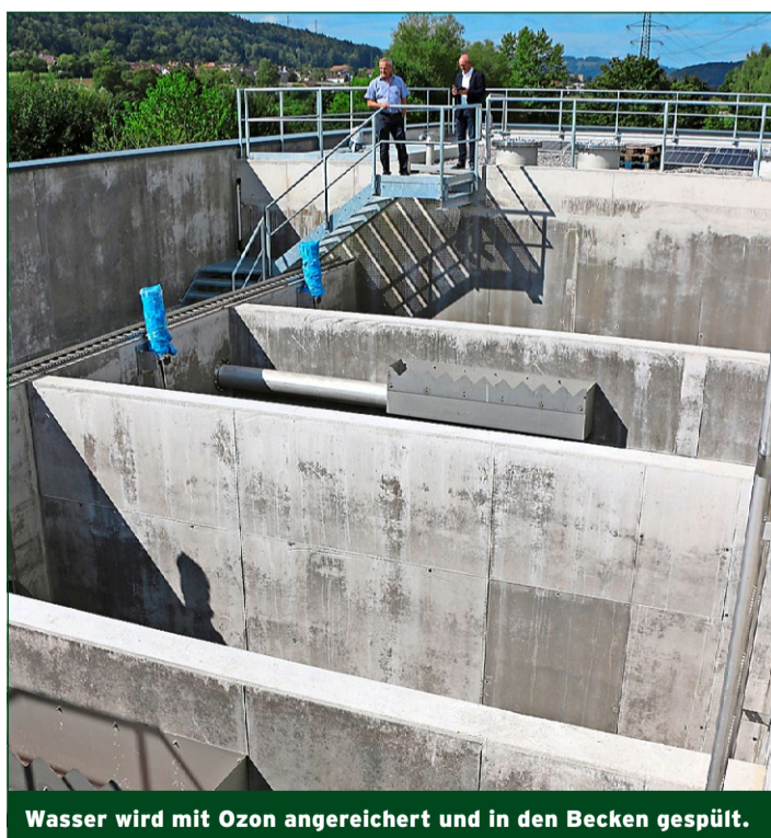
Wasser wird mit Ozon angereichert und in den Becken gespült.

tungsbedingungen verschärft wurden und die Frachten aus dem Gewerbe stetig zunehmen, passte die bestehende Anlage eigentlich nur noch für 10000 Einwohner. So war man schon über der Kapazitätsgrenze. Eine Erweiterung war also erforderlich. Der Umbau, die Erweiterung und Sanierung passieren im laufenden Betrieb, was einen erheblichen Mehraufwand bedeutet und zu Provisorien führte. Die bisherigen Klärbecken wurden gereinigt und mit einer hochwertigen Betonbeschichtung geschützt. Das neue Becken wurde schon von Beginn an mit einem Vlies in der Schalung und einer dickeren Betonüberdeckung erstellt. Das Betriebsgebäude wird ebenfalls umgebaut. Gleichzeitig wurden auf den Gebäudedächern Photovoltaikanlagen montiert. Durch das gespeicherte Methan aus der Faulanlage wird ein Blockheizkraftwerk betrieben. Daraus wird Wärme für die Heizungsanlage und elektrische Energie produziert. Neu dazu kommt jetzt dann noch die Energie aus der Photovoltaik. Rund die Hälfte des Strombedarfs der Anlage kann so künftig selber vor Ort produziert werden.